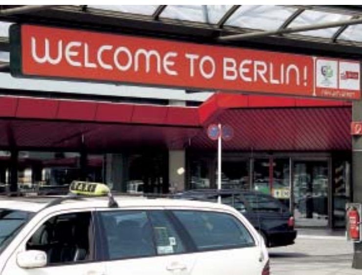
Na lotnisku Tegel