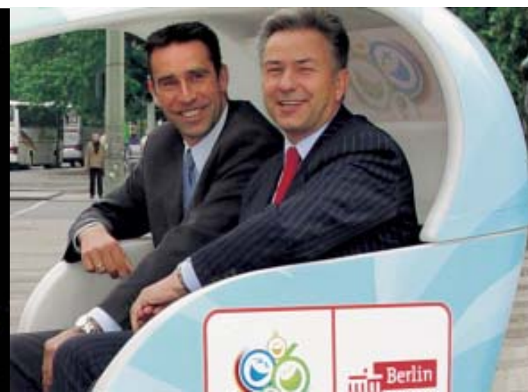
Ambasador MŚ Michael Preetz i Klaus Wowereit, Burmistrz Rządzący Berlina

Berlin Tourismus Marketing GmbH www.berlin-tourist-information.de www.btm.de/fifawm2006 T +49-30/25 00 25