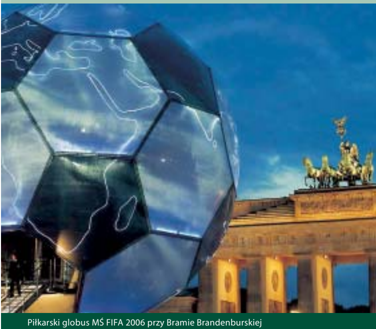
Piłkarski globus MŚ FIFA 2006 przy Bramie Brandenburskiej