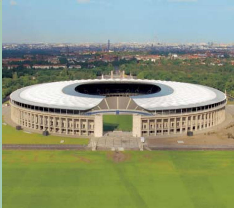
2004 – nowy Stadion Olimpijski

www.berlin.de/fifawm2006.de | www.olympiastadion-berlin.de