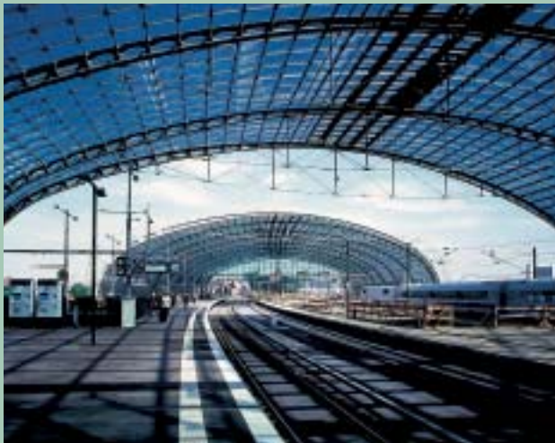
u góry: nowy dworzec główny Berlin Hauptbahnhof – Lehrter Bahnhof z prawej: hotele, domy mieszkalne i budynki firm przy Placu Aleksandra