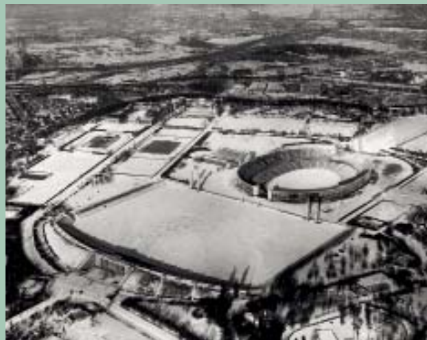
Stadion Olimpijski w 1947 r.

Organizowane przez FIFA Mistrzostwa Świata 2006™ (FIFA WM 2006™) są po igrzyskach olimpijskich największym wydarzeniem sportowym na świecie. Berlin jest jednym z dwunastu miast, w których rozgrywane będą mecze mistrzostw. Berliński Stadion Olimpijski będzie miejscem sześciu meczów, w tym również spotkania finałowego w dniu 9 lipca 2006 r. Oczekuje się, że wydarzenie to śledzić będzie na ekranach telewizorów około trzech miliardów ludzi na całym świecie.