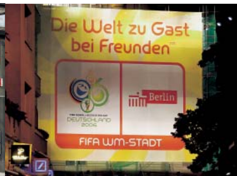
Plakat MŚ przy Placu Theodora Heussa

www.berlin-partner.de/veranstaltungen www.berlin.de/fifawm2006 | www.berlinale.de